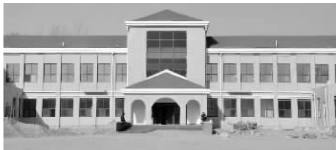
基本完工的兰考县儿童福利院

13层大厦格外显眼。大楼门口没有门牌,大厅里一块电子屏上显示“农林大厦”。曾有媒体称这是兰考县2011年确定的“80项重点工作之一”,造价5000万。