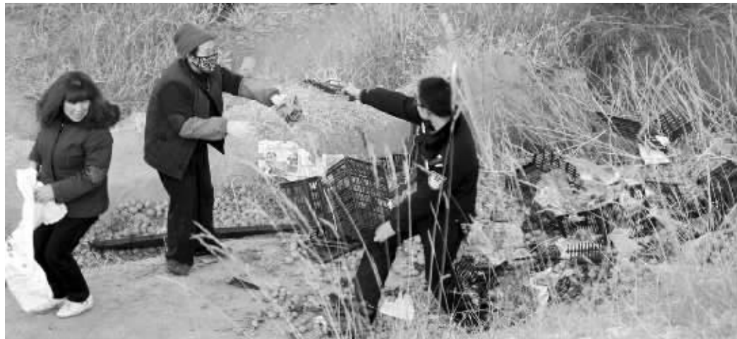
民警维持现场秩序