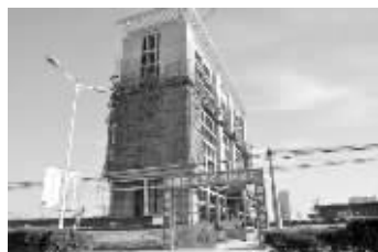
经询问,这是兰考食品检测中心