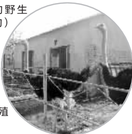
溧水一养殖场内的鸵鸟