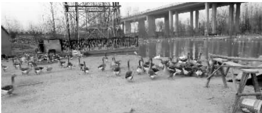
八卦洲一养殖场内,养着很多灰天鹅

在以往人们的印象中,特种养殖行业往往与高档餐饮消费等挂钩,那些喂养的“珍禽异兽”,都是价格高得吓人。不过,现代快报记者近日探访发现,这些“珍禽异兽”的价格在跳水,主要是因为国家对于公款消费、公务接待等的“限制令”。最近又出台的狠刹“会所歪风”通知,更是对高档消费浇冷水,不少养殖场已经开始谋求转型。