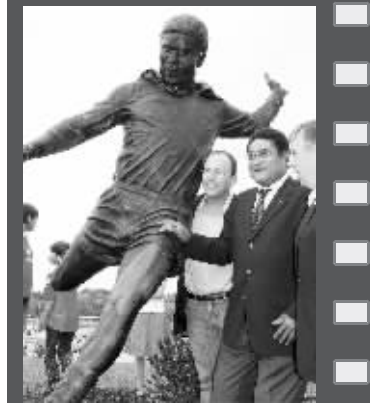
尤西比奥(中)与自己的雕像合影