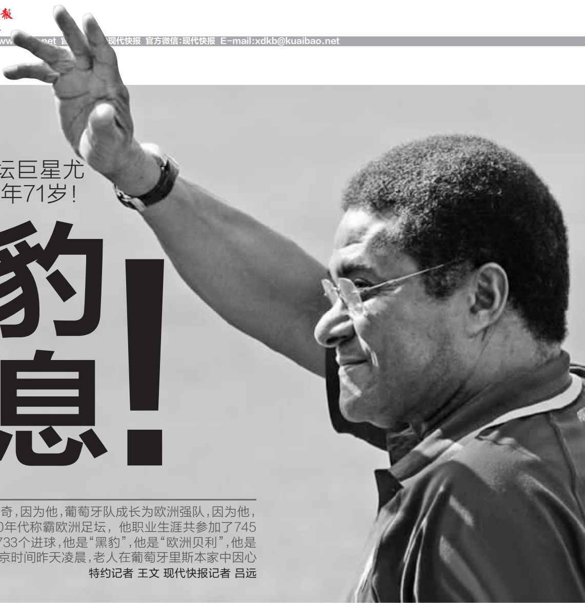
尤西比奥挥手告别了这个世界