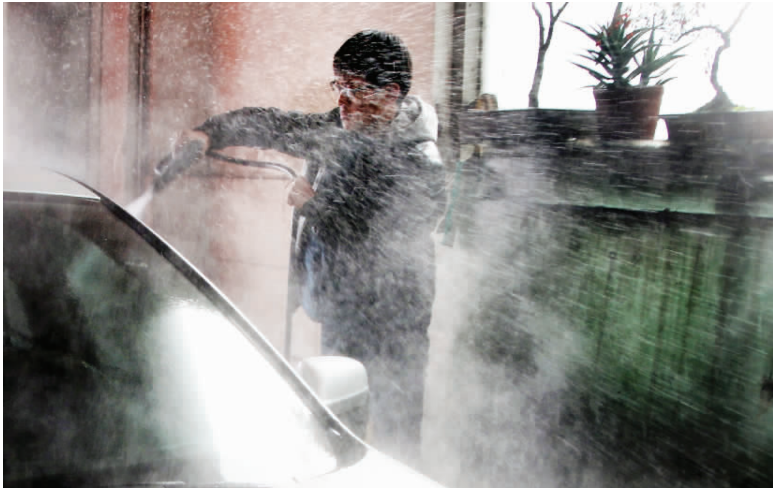
冲车时溅起的水花,给冬天里的洗车工作增加了一份凉意