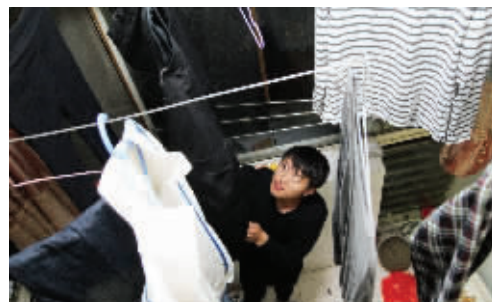
下班后洗衣、做饭,一切家务自己搞定