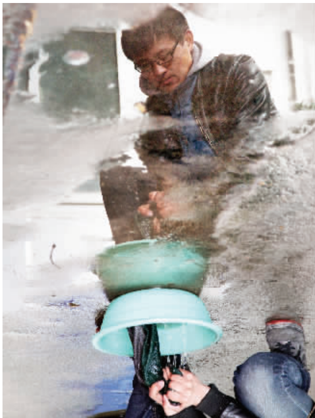
“磨刀不误砍柴工”,趁着空闲的时间把脏抹布洗一洗