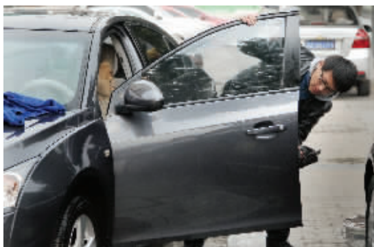
小龙擦的每一辆车都无死角