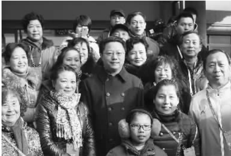
南京市委书记杨卫泽与市民合影