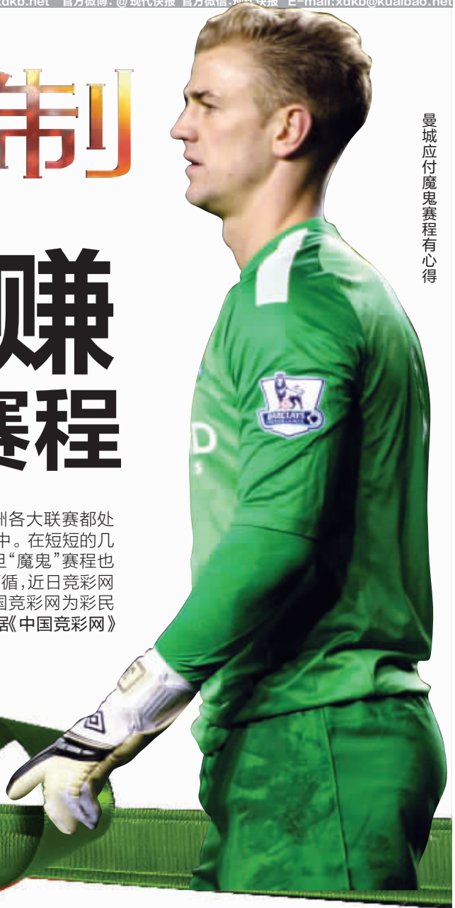
曼城应付魔鬼赛程有信心

圣诞、元旦,两大节日紧连着。这个阶段,由于欧洲各大联赛都处于冬歇期,只有英超联赛正常进行,因此投注会较为集中。在短短的几天时间里,英超球队要完成三四轮联赛,英超圣诞、元旦“魔鬼”赛程也就此成名。每年这个时候,英超竞猜都会有一些规律可循,近日竞彩网总结出了一些投注规律,和彩民一起分享。这也是中国竞彩网为彩民量身定制的一套英超投注秘笈。