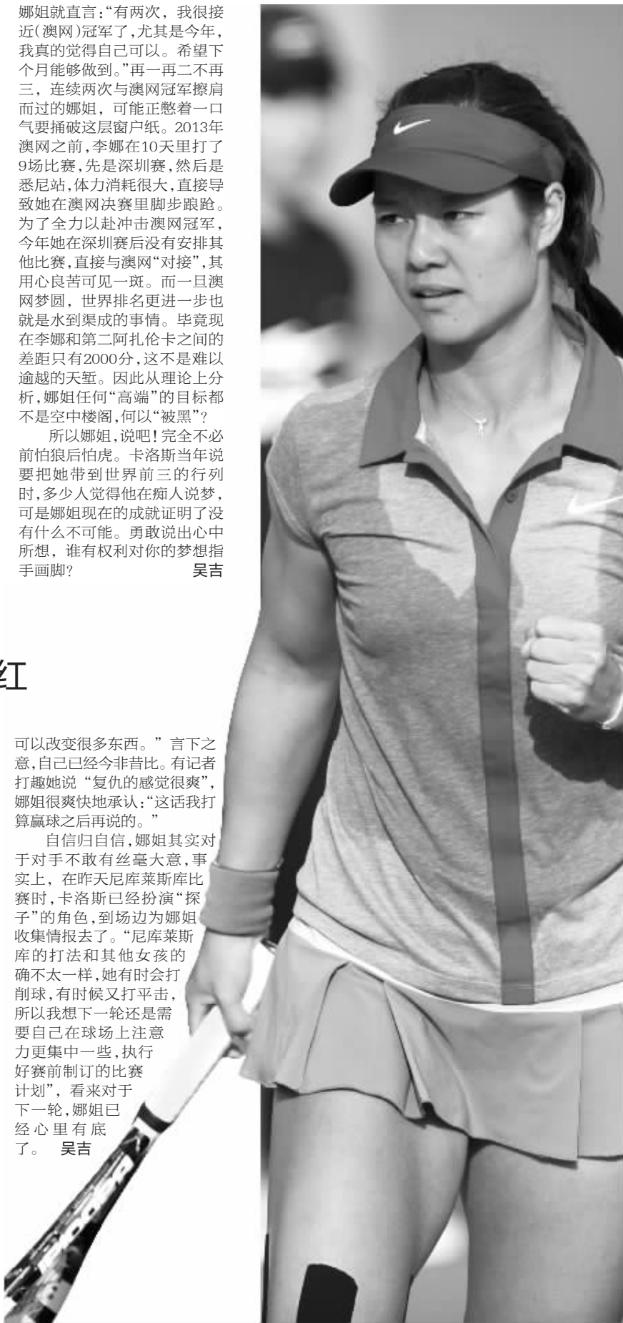
娜姐被媒体“吓怕”了

自信归自信,娜姐其实对于对手不敢有丝毫大意,事实上,在昨天尼库莱斯库比赛时,卡洛斯已经扮演“探子”的角色,到场边为娜姐收集情报去了。“尼库莱斯库的打法和其他女孩的确不太一样,她有时会打削球,有时候又打平击,所以我想下一轮还是需要自己在球场上注意力更集中一些,执行好赛前制订的比赛计划”,看来对于下一轮,娜姐已经心里有底了。 吴吉