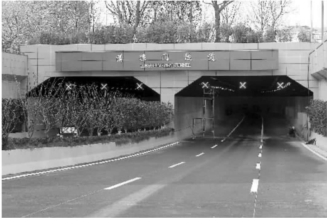
清凉门隧道跨越汉中门和清凉门两个路口

1.莫愁湖东路,设置夜间停车路段,允许19:00~7:00两侧路边停车。 2.赛虹桥广场北口(由北向南)路边停车取消,路内禁止停车。赛虹桥广场北口高架桥下停车场(因内环线施工新建的)保留,并进行扩建,缓解停车难。 3.施工期间增设的清凉门大桥下停车场、凤凰亭停车场、龙园北路停车场、长虹路等路外停车场,继续使用。