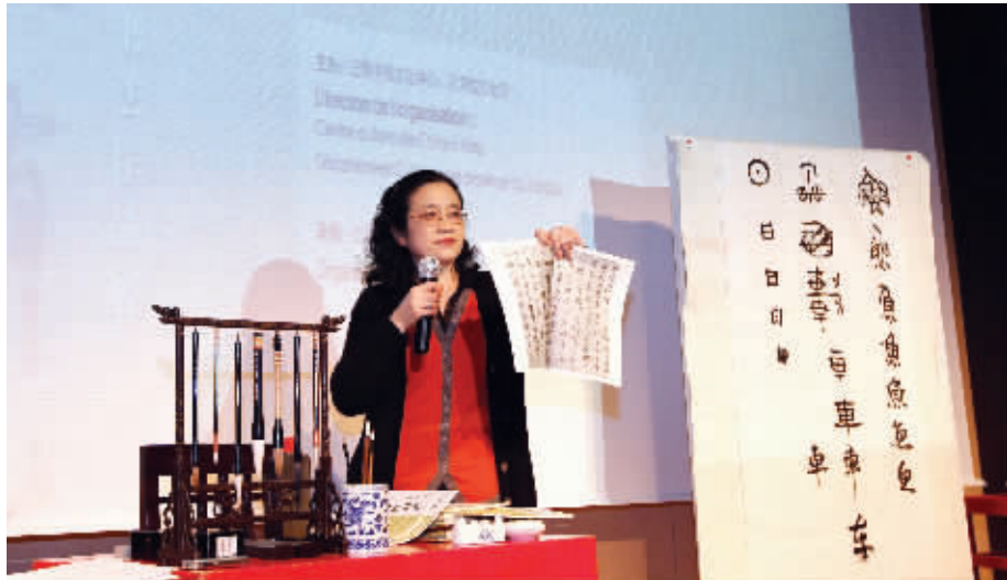
今年3月，孙晓云在法国举办个展并举行了一场书法常识讲座，推广书法艺术

12月21日至23日，江苏省书法家协会第四次会员代表大会在南京召开。大会经过民主程序，选举产生了省书协新一届理事会和省书协第四届主席团，孙晓云当选主席，徐利明、李啸、王伟林当选副主席。