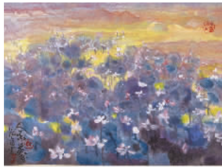
聂危谷绘画册页作品之一