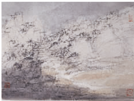
常进绘画册页作品之一