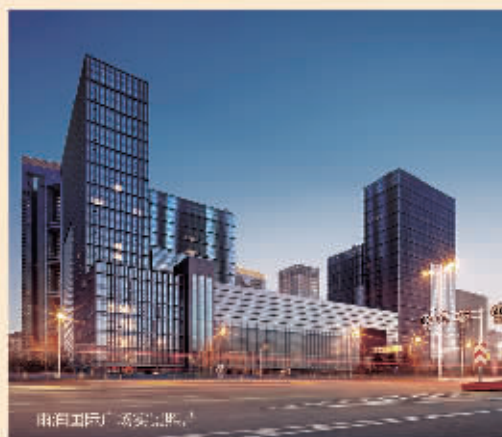
雨润国际广场实景图

南京,作为雨润集团的总部,是唯一一个聚集雨润地产三大产品线——“星雨华府”、“雨润国际广场”、“满月楼”的城市,更是其产品线的开埠之地。在新年来临之际,南京星雨华府与南京雨润国际广场携手礼献,恭贺新春。