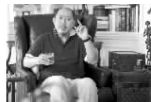
电影《私人订制》中的李诚儒