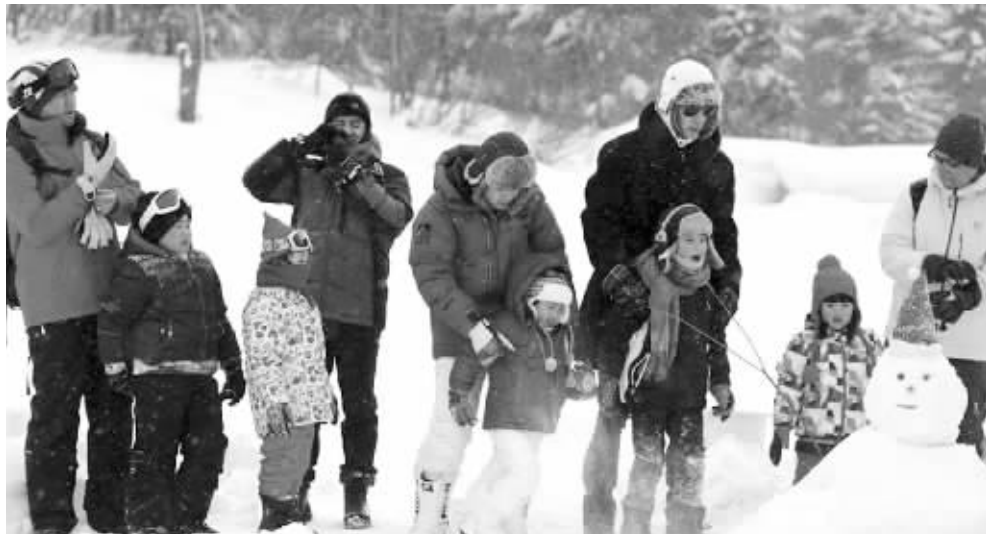
爸爸们带着孩子在雪乡