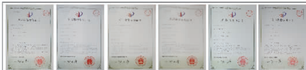
国内唯一获得六大专利的美眼品牌 超10万女性信赖的基石