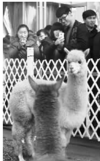
商场请来“神兽”助阵

平安夜,当夜幕降临,大街上、商场里、教堂外、酒吧街……到处都是脸上洋溢着笑容的市民。新街口的一家商场出新招,请来“神兽”助兴;而在1912街区,因为人太多,地上的烟头都有平日的两倍多。