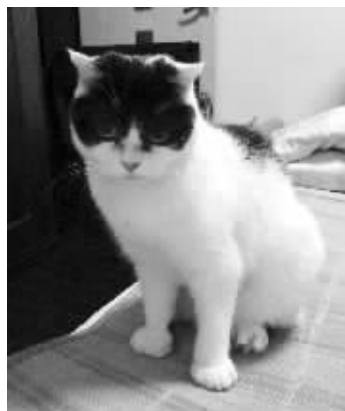
看我的哈雷墨镜酷不酷