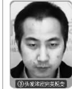
③ 头发浓密完美蜕变

经典项目 头发种植/眉毛种植/睫毛种植/美人尖种植/鬓角种植/疤痕种植/胡须种植/发际线调整/比基尼种植等