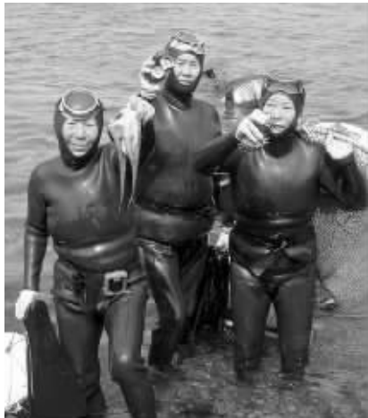
海女是非常古老的职业

徒手捕捞海产的海女文化源远流长,随着日剧《海女》大热,令海女成为吸金招牌,带旺相关旅游业。然而韩国政府近日宣布,决定将济州岛海女申请列入非物质世界文化遗产,引发日本强烈不满,因为日本也有意将海女申遗,不料却被韩国抢先一步。