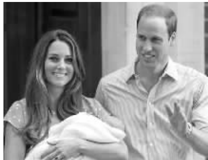
小王子乔治将度过人生中的第一个圣诞节

英国王室一名负责安排的人称,许多接到邀请的宾客将必须共住一房,有的还甚至不得不住到平常佣人住的地方。他解释说,