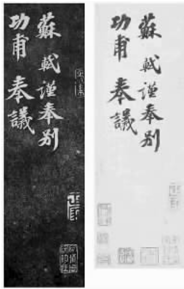
图①《安素轩石刻》中的苏轼《功甫帖》拓本(左)、《功甫帖》钩摹本(右)

研究员们认为,书法是笔墨与纸张的关系,石刻则是刀、石关系;刻工有高低,拓本之好坏又涉及拓工、装裱的名家与否。总之,诸多不确定因素的叠加造成了石刻及其拓本自身的局限与特点,即无法达到书家自然书写时的浑然天成,比如“牵丝”“飞白”等。此件《功甫帖》钩摹本还是从石刻拓本中钩摹出,而非原作钩摹。