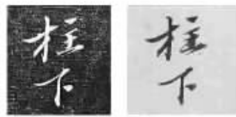
图②《诒晋斋法帖》《刘锡敕》拓本(左)、“柱下”《刘锡敕》钩摹本(右)