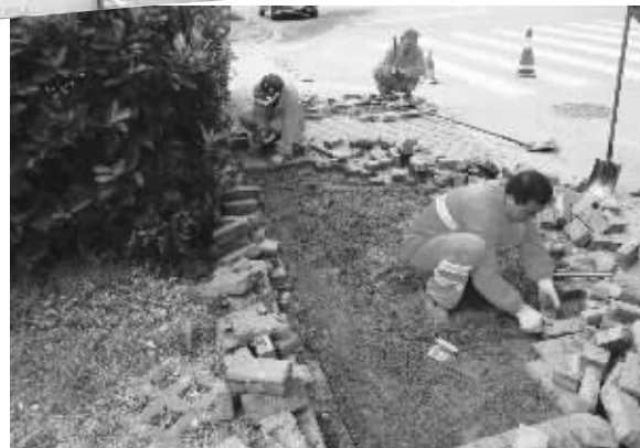
市政养护工人修补人行道板