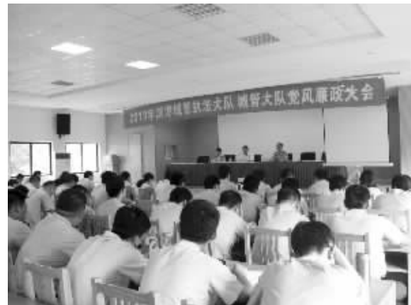
对执法队员进行廉政教育