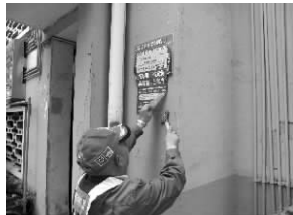
实现“三乱”市场化保洁