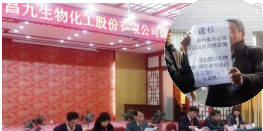
昌九生化媒体说明会现场,情绪激动的股民含泪展示“遗书” 资料图片

因重组梦碎,作为“两融”标的的昌九生化连续上演7个跌停,酿出A股两融第一惨案。昨日,昌九生化在赣州市举行媒体说明会,对投资者普遍关注的问题以及市场的质疑进一步作出澄清和说明。尽管此次说明会并未邀请股民,但不少投资者都来到现场,甚至与工作人员发生了肢体冲突。