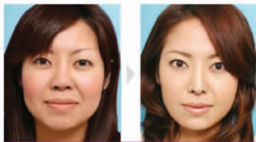
真人案例 假包必究

全程治疗过程中，如眼袋无法去除，消费者可随时要求全额退款；5年内如眼袋反弹，消费者亦可要求获得退款。全程签约，退款保障，眼袋无忧。