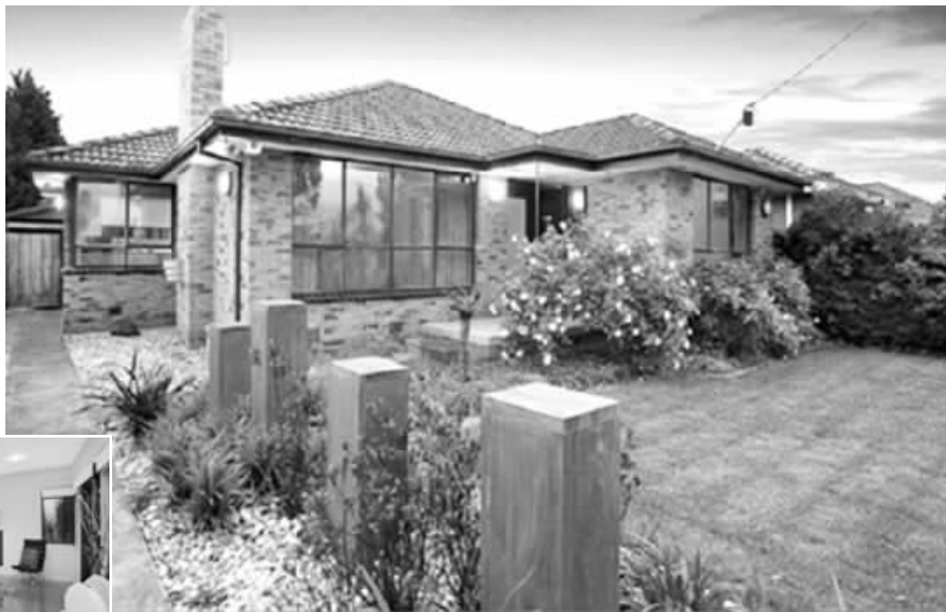
▲这是套三卧室平层住宅

澳大利亚前总理吉拉德位于墨尔本西区奥托纳区的别墅最近以92.1万澳元(约合500万人民币)的价格被一位神秘的浙江商人买到,这位来自浙江镇海的商人名叫汪正亮,他说,“我一心想买到这栋房子给我的太太作为礼物,因为她是吉拉德的粉丝,当年在国内事业发展顺利,曾想像吉拉德一样一步步奋斗,在事业上有所作为,却因为当年跟我来到澳大利亚吃苦,放弃了,我很感谢她。”