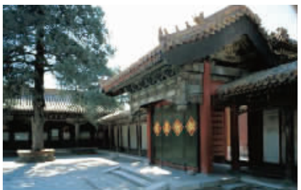
钟粹宫内的垂花门