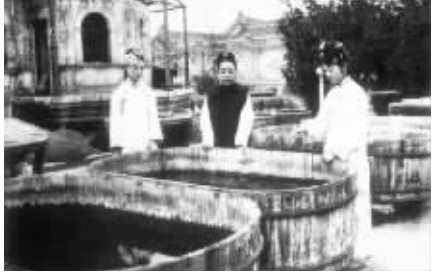
瑾妃在水晶宫观鱼