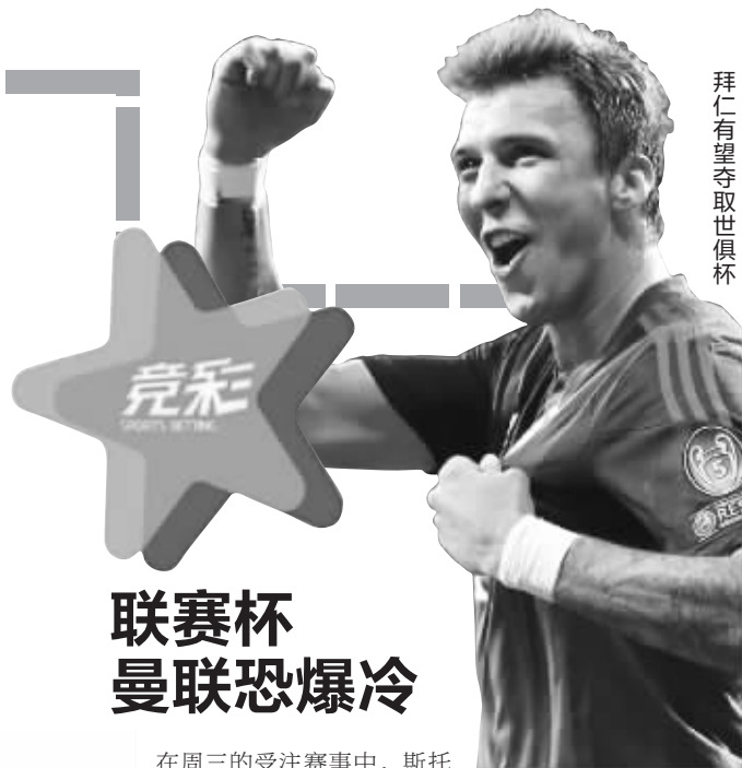
拜仁有望夺取世俱杯

本赛季,瓜迪奥拉对拜仁的改造相当成功,拜仁在不断书写着德甲各项新的纪录。拜仁目前的打法更具冲击力,而且更为讲究整体,这从客战不来梅的比赛就不难看出。虽然球队在那场比赛中打进了7个进球,但是进球却是来自不同的球员。这说明球队的进攻实力非常均衡,球队不是依靠某一个球员在得分。以拜仁目前的状态,夺取世俱杯冠军只是一个时间的问题。