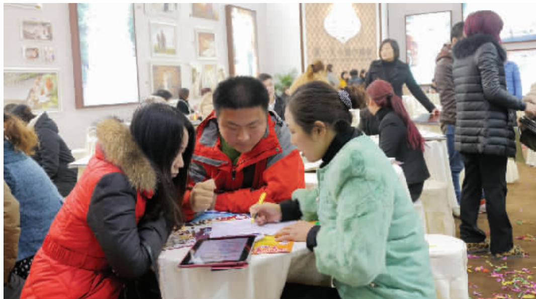
结婚采购大会现场