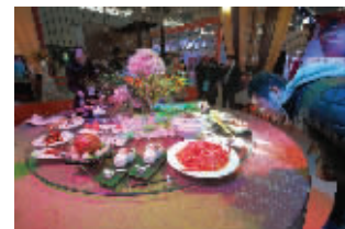
结婚采购大会现场

为迎接本次结婚采购大会,金夫人婚纱前所未有地第一次推出“婚礼一站式服务”限量超值完美套餐,即定婚庆送婚照,婚庆加婚照享受婚庆半价活动。