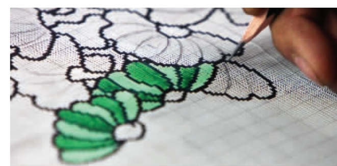
将拷贝过来的白描稿描图、上色,这个步骤叫做“意匠”