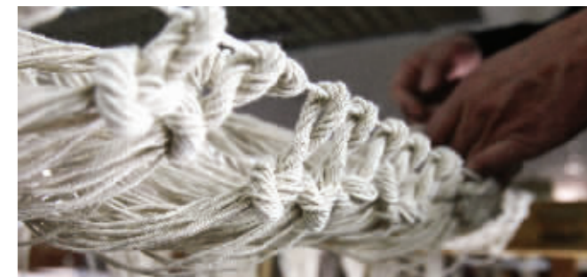
花本程序好似密码,蕴藏在这一个个绳结之中