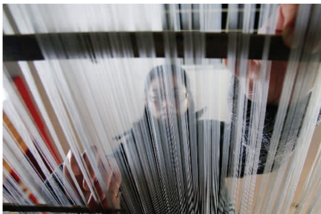
对照绘制好的意匠图,挑花工用丝线作经线,用棉线作纬线,以结绳记事法将结构、位置、色彩的所有信息编制成花本程序