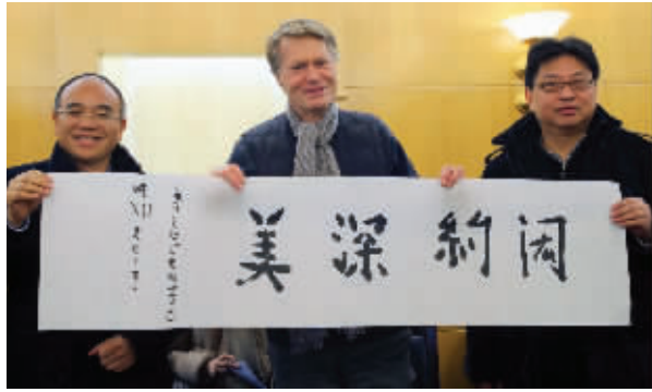
勒·克莱齐奥展示他的毛笔字

“学生交的作业非常精彩,我甚至希望能给他们评100分!但许钧教授说,在中国,一般不给学生打100分,所以最后我才给其中的5个学生打了98分。”10月17日,2008诺奖文学奖得主勒·克莱齐奥在南大首次开讲《艺术与文化的多元阐释》,近两个月过去了,课程结束,今天,克莱齐奥将启程离开南京。昨天,在南大举行的“思想家评传”中英对照版赠书仪式暨诺奖得主勒·克莱齐奥研究文集首发式中,他表示明年在南大开设的课更有趣,主讲电影与文化,甚至包括中国导演贾樟柯的电影,而且还将南大带博士生。