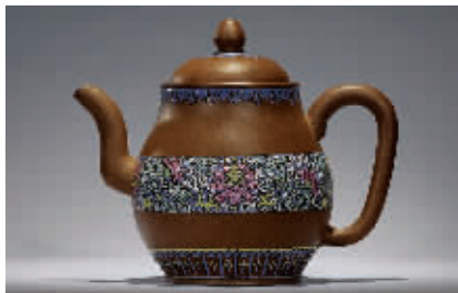
朱元熙制粉彩梨形壶 清 宽20.5厘米 高18厘米