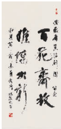
林散之《百花齐放》 106cm × 50cm

上午9:00 古董珍玩(一) 上午10:00 古董珍玩(二) 下午1:30 玉器专场