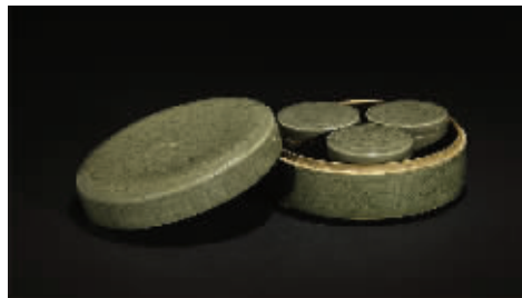
耀州窑青釉套盒(一套四件) 北宋 直径17.6厘米 高8厘米