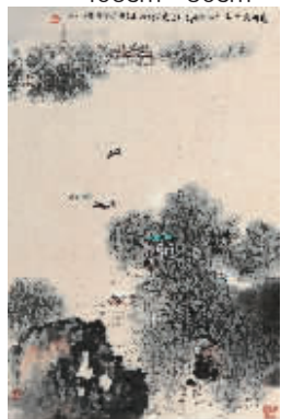
钱松岳《扬州瘦西湖》 65.5cm × 43.5cm