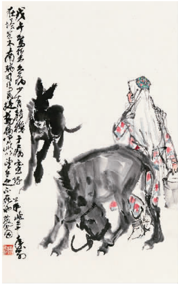
黄青《喂驴图》83cm × 51cm