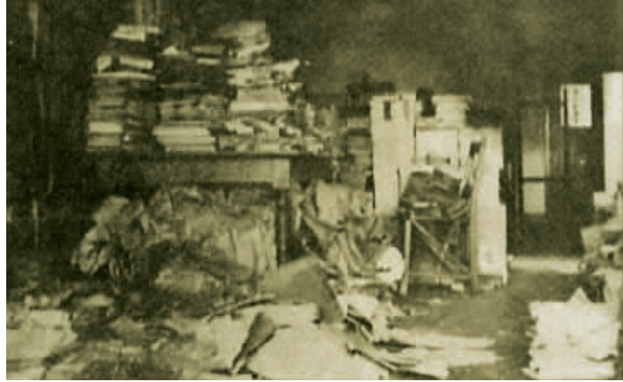
金陵大学中国文化学院被日军劫掠后的情形

昨天,南京大屠杀史研究会副会长、南京医科大学教授孟国祥著的《江苏文化的劫难》一书首次披露了日军的“文化大屠杀”。侵华日军南京大屠杀遇难同胞纪念馆馆长朱成山认为,开展战时文化损失研究,不仅可以深化对日本侵华罪行的本质的认识,拓展南京大屠杀研究领域,而且也是对日本否认文化侵略的行径有力回击。