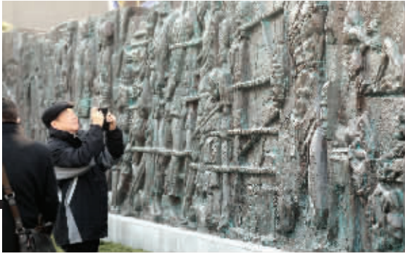
青铜浮雕墙正式亮相

此外,今天上午还将举行江苏省暨南京市各界人士悼念南京大屠杀30万同胞遇难76周年仪式暨南京国际和平集会,各界代表将在纪念馆悼念广场上宣读和平宣言、撞响和平大钟。 现代快报记者 赵丹丹