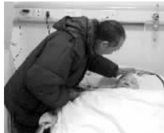
钱老伯守护在老伴床边

不仅是捐款,哪怕是饼干、团子、水果等也都一个不落地记录下来。“到目前为止,我们治病借了好几万,好心人捐助了3万多元。我年纪大了,记性越来越差,我怕自己会忘了,所以要一笔一笔记下来。”