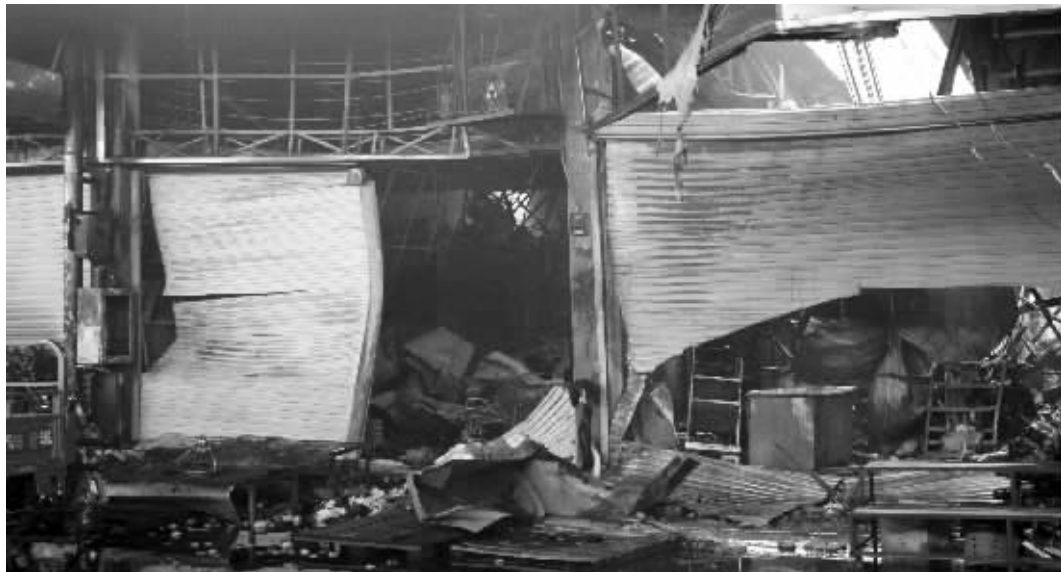
发生火灾的菜市场内一片狼藉