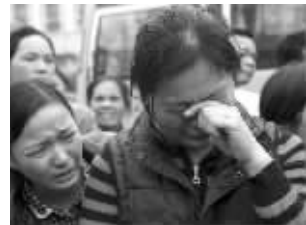
死伤者家属聚集在火灾现场外

12月11日凌晨,发生在深圳市光明新区一农批市场的大火造成16人死亡、5人受伤。记者调查发现,生产、仓储、居住“三合一”,消防栓打开却没有水压,房屋是临时搭建……这些“似曾相识”的原因导致了火灾惨剧的发生。