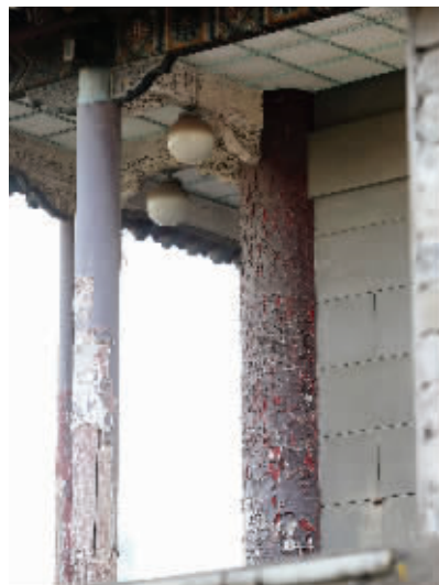
城楼廊柱上的油漆已经斑驳脱落

大门都开着,而且免费参观。记者从一位工作人员处了解到,当天城楼暂时停止对外开放,“你等明天再来吧。”她说。