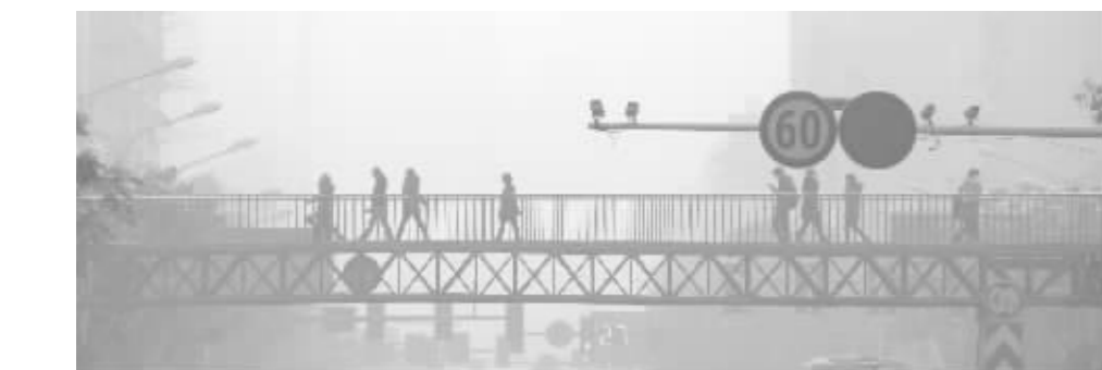
南京市中心能见度很低