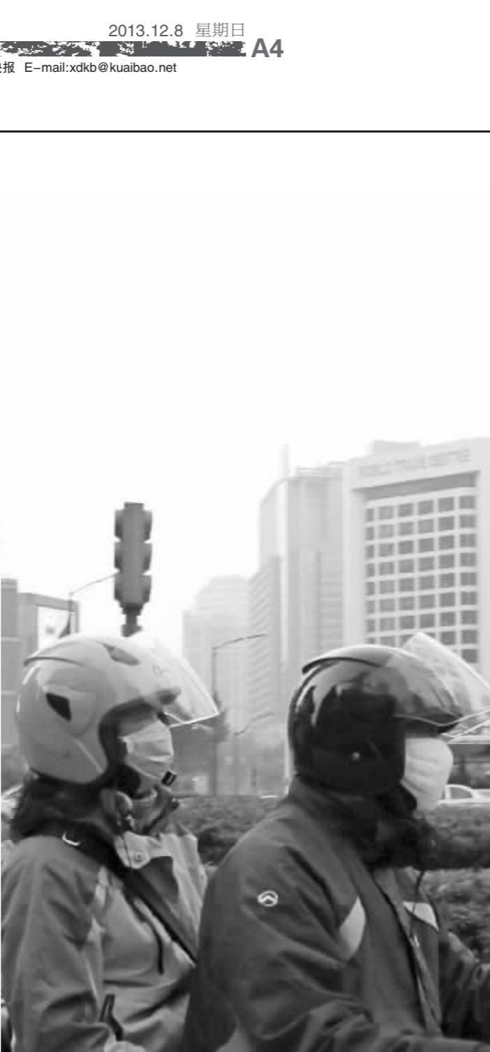
南京连续多日雾霾迷城，估计就连“中山先生”也感觉到“呼吸不畅”