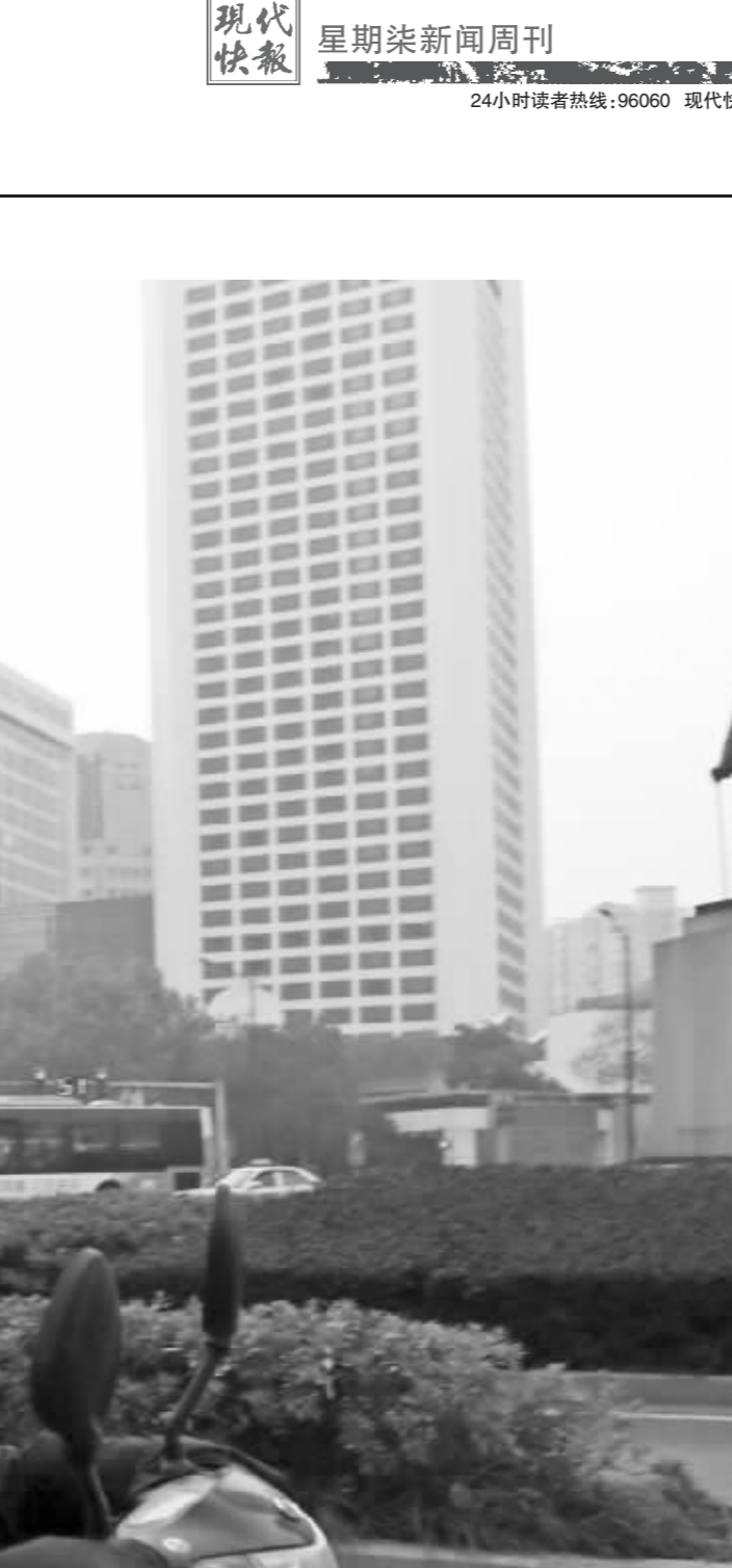
南京连续多日雾霾迷城，估计就连“中山先生”也感觉到“呼吸不畅”