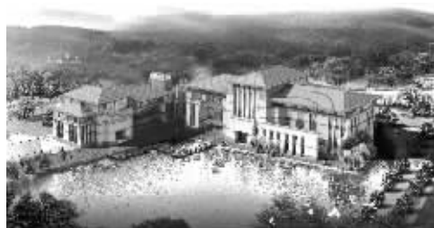
可一美术馆效果图

在艺术节之外，可一美术馆的学术性价值还体现在多方位的分析研究。此次将举办的可一论坛，会对展览进行后续学术性研究，并对展览作品和“江南叙事”主题进行深入探讨。