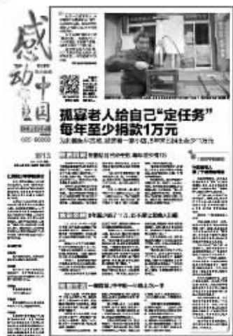
现代快报此前的报道