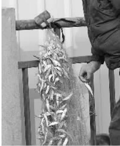
捞上来的都是鱼苗

昨天,一位市民反映,龙蟠中路双桥门高架桥下的武定门闸管理所附近,每天都有人用小渔网在秦淮河里捞鱼,之后贩卖。捕捞出来的都是小鱼,这让许多市民担忧会伤害生物链,希望有关部门加强管理。 现代快报见习记者 吴頔