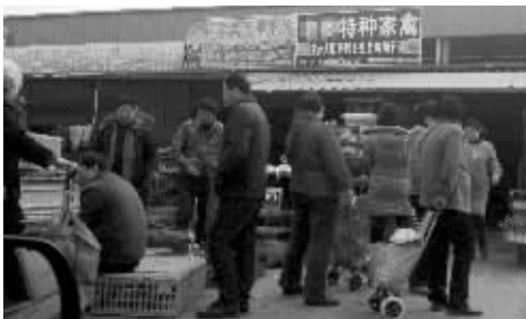
这家店铺招牌上写着主营大雁、野鸭等