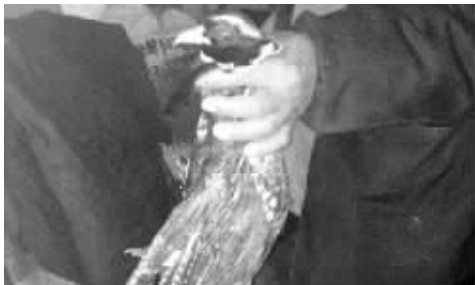
老板当场拎出一只野鸡