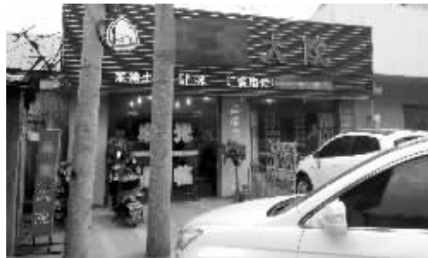
这家饭店的招牌上公然写着野味字样