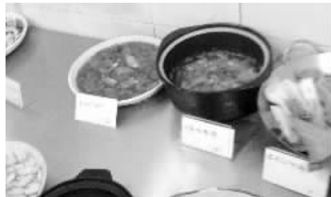
另一家饭店的后厨,摆着不少洗净装盘的野味