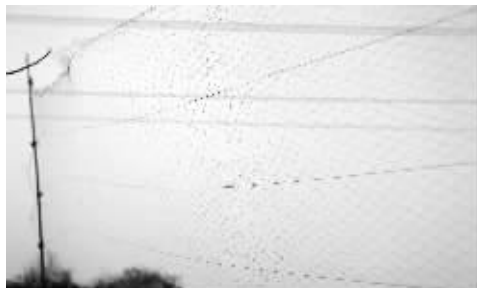
大网拉开,等鸟儿来