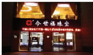
今世福珠宝南京直营店

今世福钻石、翡翠直销惠售出的钻石、翡翠,消费者凭质保单可在今世福南京直营店享受调换、保养、清洗、维修等服务,让您售后无忧。今世福南京店