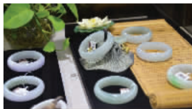
此图为活动货品实物实拍