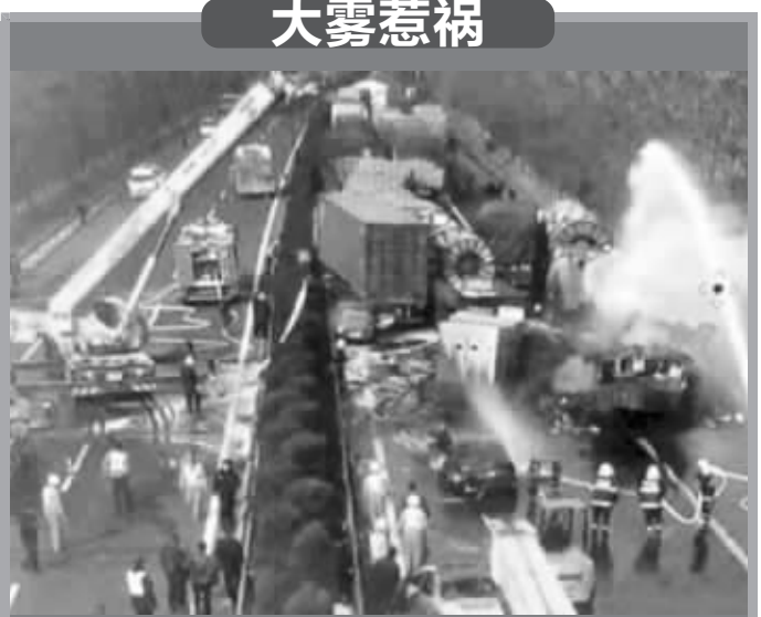
车祸现场

专家介绍,选购口罩,首先查看包装上的标识,不要购买“三无产品”。除此之外,如果购买一般的非医用口罩,消费者最好还要进行彻底的漂洗,佩戴才比较安全。