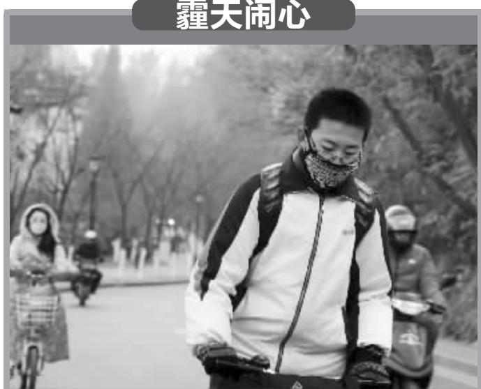
昨天,南京市教育部门紧急通知各区,中小学生们停止户外活动