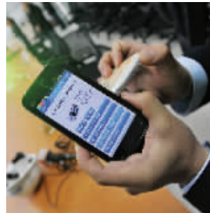
扫一扫就知道药品信息

不过,目前这个软件只收入部分常用药品,有些药品暂时还查不到,不过预计到2015年,就能覆盖到所有的常规药品和一些非常规药品。