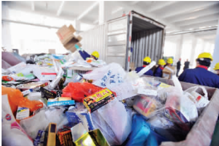
要销毁的假劣药品