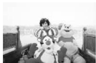
《小熊维尼·经典童话之旅》剧照

12月21日下午,世界童话盛典《小熊维尼·经典童话之旅》将在南京人民大会堂欢乐上演。记者昨天了解到,主办方考虑到很多孩子要上培训班看不了演出,所以在晚上加演一场。