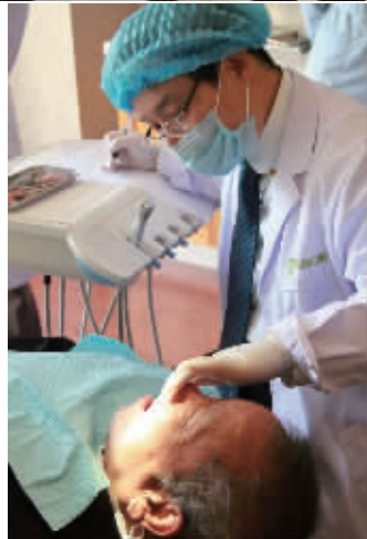
▲韩国专家吴相润博士正在给患者进行种植牙手术

排就已经排到了晚上7点多。 来自安徽的这两口子当场就不乐意了,凭什么呢,自己好不容易等到国际专家的亲诊,不仅请假扣了工钱,还一大早赶着长途车来的,无论如何这次也要让老爷子给国际牙医看看。陆敏一看,只好找医院负责人来接待这对夫妇。 医院负责人把这一行三人请入了贵宾室,经过一个多小时的沟通,三位顾客终于带着满意的笑容离开了,临走时约定12月1日,一定让吴博士亲自为老爷子种牙。