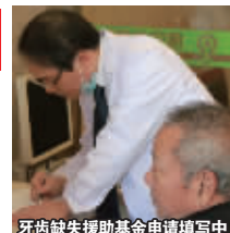
牙齿缺失援助基金申请填写中

康贝佳口腔拟启动“中老年人牙齿缺失援助基金”,凡是有牙齿缺失的中老年朋友可拨打400-000-0005申领1500-3000元的种植牙基金援助,活动期间免专家挂号费、看诊费用,更多康贝佳口腔援助优惠活动也可直接登录www.kangbeijia.com详询活动信息。