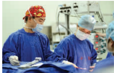
在手术室内密切配合医生们工作