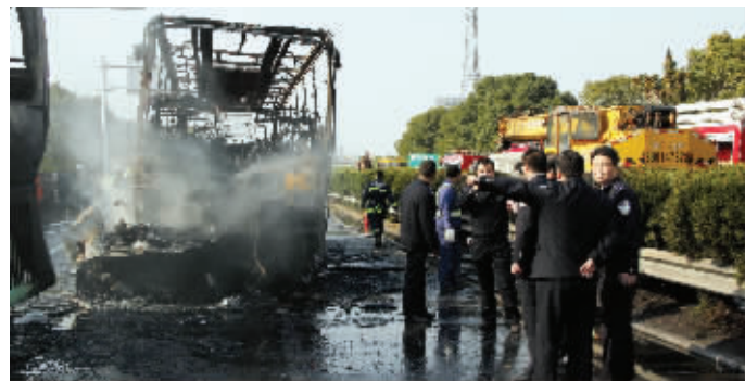
车子已烧得面目全非