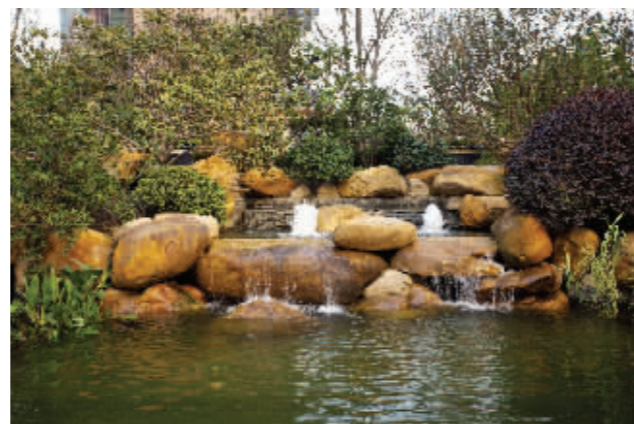
高标准小区景观,匹配高素质的居住人群

业内人士认为,南京要真正实现“大南京时代”,仅仅规划新区是不够的,还应该匹配足够的核心产业,拥有高素质的居住人群,这才意味着江北彻底融入“大南京”。目前浦口新城已引入多个产业核心,未来仍在继续引入。而作为江北乃至整个南京豪宅标杆的雅居乐滨江国际,能够吸引南京各界精英人士,其意义十分巨大,表明南京的精英阶层认可浦口的区位优势,“大南京时代”已初具规模。