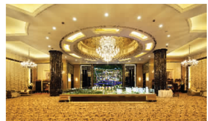
金碧辉煌的雅居乐高档会所

而此次“来自台湾的潮”刮到南京,献唱雅居乐滨江国际,这场音乐盛宴将会邀请到怎样的音乐唱将,我们拭目以待。细数雅居乐地产近几年与各种大腕强强联合举办的高端文化活动,可谓是不胜枚举。 雅居乐十分注重为业主打造高端圈层生活,无论是享誉国际的音乐家、经济学家还是炙手可热的演艺界名流,都有可能成为雅居乐的座上客,与业主零距离互动。在得知“台湾潮”将会落地雅居乐滨江国际,各路歌迷与业主已经开始心动,表示将会到现场支持偶像。