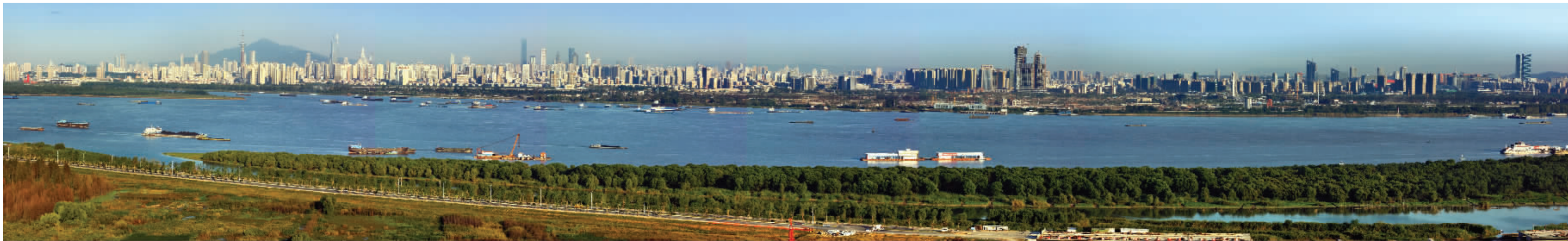
浦口新城备受瞩目,标志着“大南京时代”正加速实现