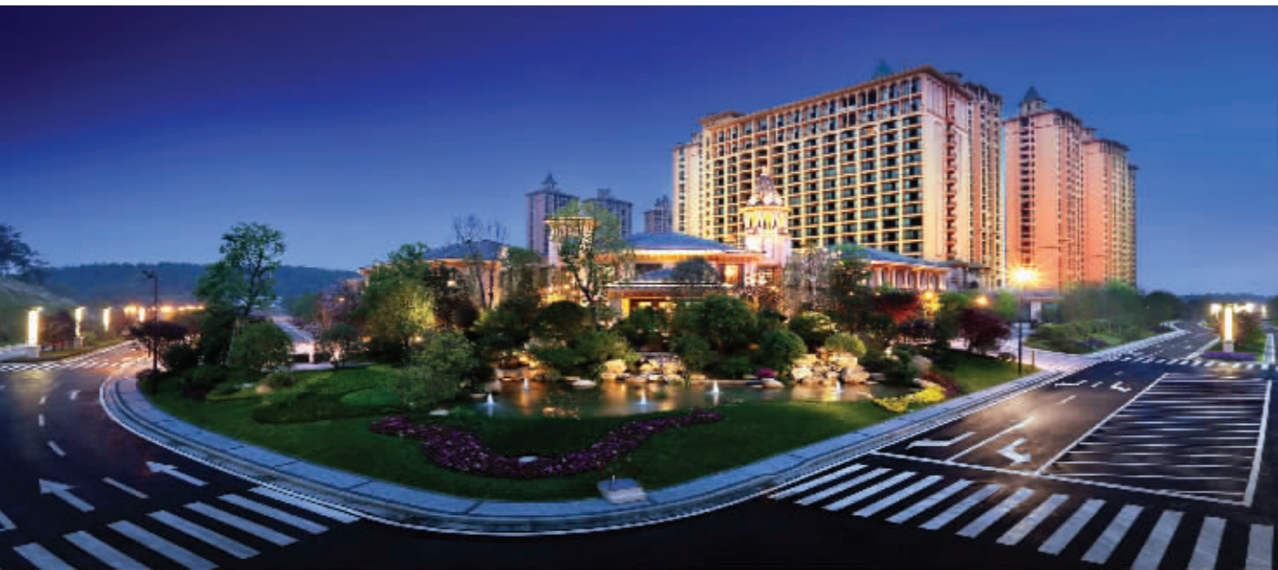
据统计,开盘当日雅居乐滨江国际住宅的认购金额已近5亿

百万的246㎡及280㎡户型同样受到客户认可,销售情况良好。 由于十分看好雅居乐滨江国际所聚合的旺盛人气以及高端业主群,商铺去化十分迅速,当日几乎售罄。 据统计,开盘当日雅居乐滨江国际住宅的认购金额已近5亿元,成功打响第一枪。