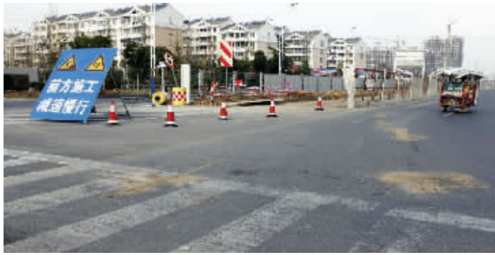
事故现场设有减速警示牌

而记者发现,一些非机动车在通过路口时,也不注意观察周围的机动车。有的电动车在路口横冲直撞,甚至逆向行驶,安全隐患很大。