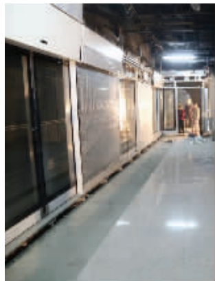
站在装修中

“下一步将进行出入口等附属结构设备、空调、通风设备安装及给排水施工。”建设方介绍,目前,10号线设备安装工程总体完成约75%,其中进度较快车站已完成约90%工作量,进度较慢的车站也已完成约60%,所有车站计划于2013年底基本完成安装工作。全线整体装修也已完成约40%,计划于明年初完成车站内公共区装修工作,剩余附属结构装修及地面景观工程将于上半年内完成。