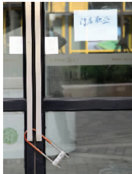
不少商户已经关门歇业