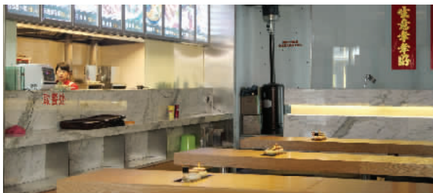
名品城里少数开门营业的店铺也是冷冷清清