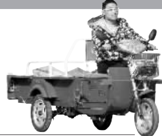
开着三轮电动车送快递