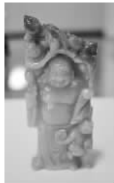
很多上乘的玉器都是扬州制造